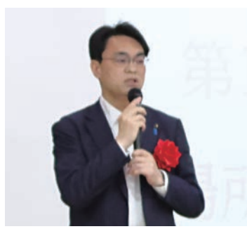
来賓挨拶 渡辺慎一新潟県東京事務所長