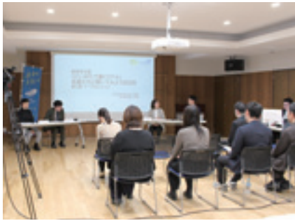
若手社会人3人によるトークセッション

日時…令和8年2月21日（土）13:30～15:30 場所…東京新潟県人会館 2階ホール