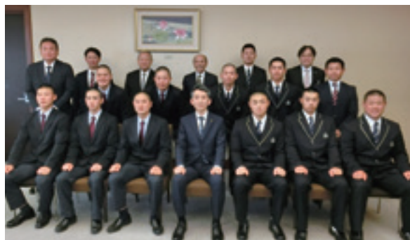
新潟県庁を表敬訪問した帝京長岡と日本文理の選手たち

若者の活躍の場として関心を集めるもののひとつに高校野球がある。多くの人が古くから春の選抜、夏の甲子園に関心をもち注目している。NHKでは古くからラジオとテレビで全国中継を