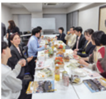
新潟ゆかりのお菓子を囲んだ交流会

にいがた鮭プロジェクト事務局 （新潟日報社総合プロデュース室）025(3805)7473