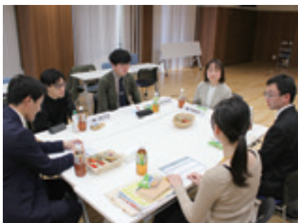
社会人と学生の交流会

イベントの後半は、ゲストと学生がテーブルを囲み、新潟ゆかりのお菓子を食べながら気軽な雰囲気で行った交流会を行いました。就活中の学生からは、志望業種を絞り込むポイントについて質問が出ました。社会人の先輩は「自分にとっての得意なことと好きなことを見極めて、その二つが重なる業界や仕事内容で絞っていくのも良い」「学生時代に力を入れたこと、これまでやってきたことを軸に選ぶのも一つ」などとアドバイスしていました。