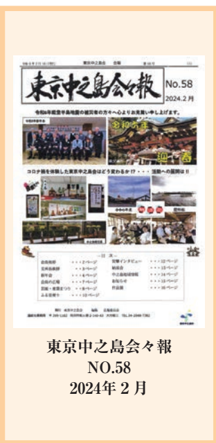
東京中之島会々報 NO.58 2024年2月

■東京中之島の故郷、長岡市中之島は、越後平野のほぼ中央に位置し、弥彦山や守門岳をその背景に穀倉地帯が大きく広がっている。会の創立は、平成7年2月19日（創立時会長・阿部俊六）。現会員数は約1000名。 ・「新年のごあいさつ」長岡市中之島支所長 田中剛……………3 ・「令和6年新年会」……………4～6 以下、「会員の広場」7／「芸能・産業まつり」8／「ふる里便り」10～11