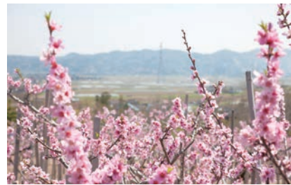
砂丘桃で花見はいかが