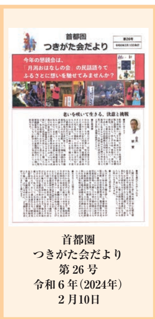
首都圏 つきがた会だより 第26号 令和6年(2024年) 2月10日