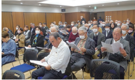
熱心に講演に耳を傾ける参加者たち