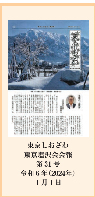
東京しおざわ 東京塩沢会会報 第31号 令和6年(2024年) 1月1日

■東京塩沢会は、平成元年（1989年）7月、首都圏に在住する旧塩沢町出身の同郷者同士で親睦を図る 2. 会を通じて故郷との親善交流を深め、その発展に資する ・「新年のご挨拶」 南魚沼市長 林茂男 ・「令和5年度総会及び懇親会報告」